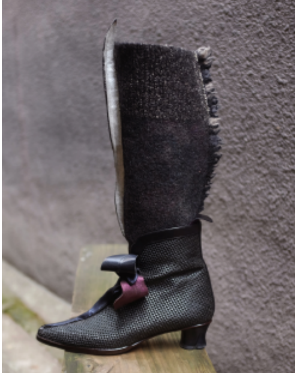
花のショートブーツと フリンジのレッグカバー