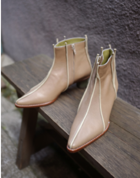
樹のミディアムブーツ